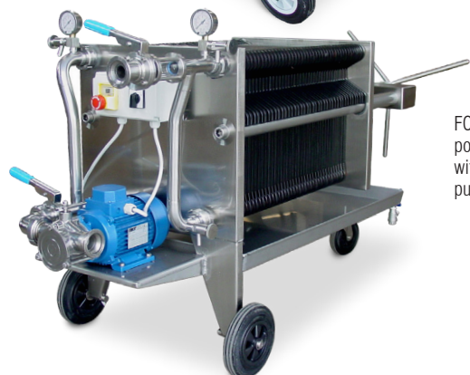
FC 40x40 con pompa tipo Z70/ with Z70 impeller pump