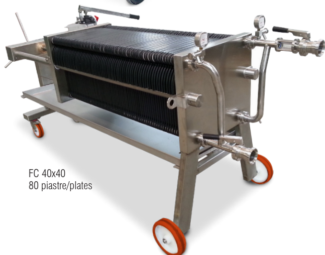
FC 40x40 80 piastre/plates