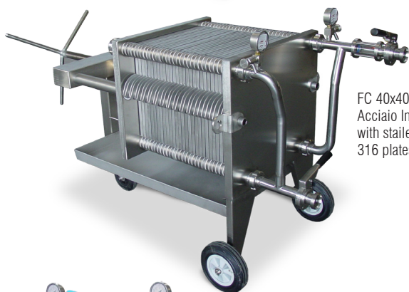
FC 40x40 con piastre in Acciaio Inox AISI 316/ with stainless steel AISI 316 plates