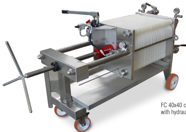
FC 40x40 con chiusura idraulica/ with hydraulic closure